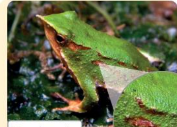
Ranita de Darwin